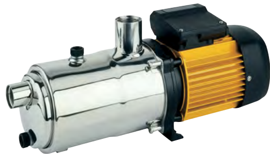
Tabla de características